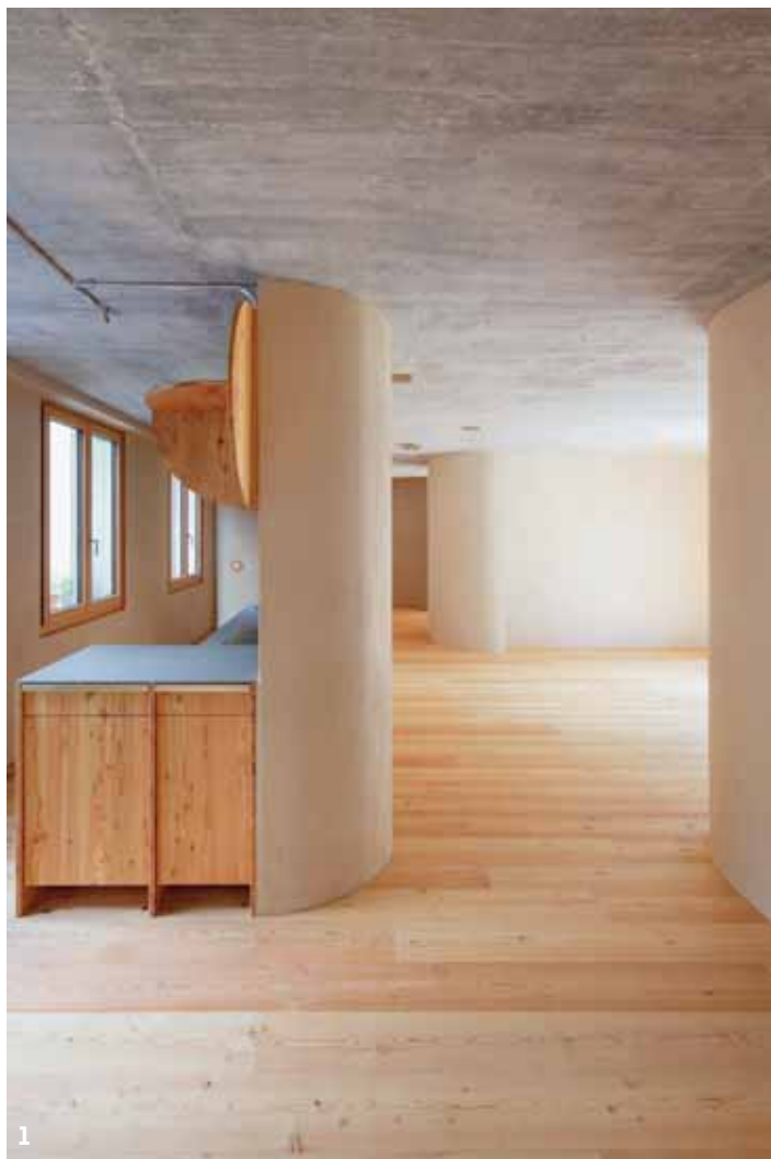
1. Cuisine La partie destinée à la préparation des repas et à la salle à manger ne devait pas être trop petite. KARL NARAGHI, CBA

Ce qui a séduit les architectes dans l'habitat biennois, c'est la volonté de la propriétaire de disposer d'un lieu plus en accord