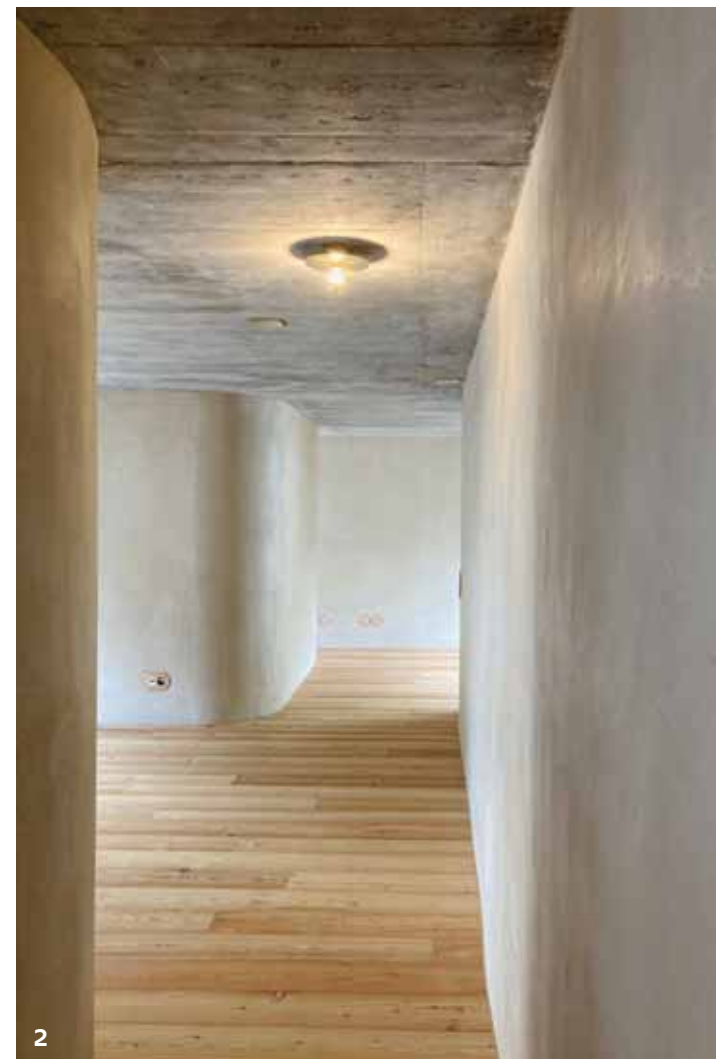
2. Murs Incurvés et enduits d'argile, ils créent une atmosphère douce et chaleureuse. CBA